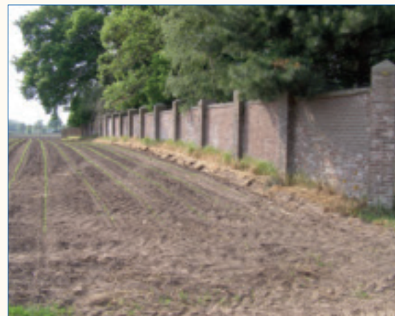
Twents coulisselandschap met sterke cultuurhistorie.

Een ander gebiedsontwikkelingsproject waar Marb Consultancy bij betrokken is, is die van de gemeente Berkelland. 'We hebben daar in samenspraak met de betrokkenen binnen de gemeente Berkelland, de Gebiedscommissie Berkelland, het Plattelandshuis Achterhoek-Liemers en de provincie Gelderland het uitvoeringsprogramma opgesteld, de organisatie vormgegeven en het procesmanagement van de uitvoering verzorgd. Onderdeel daarvan was bijvoorbeeld de afspraak tussen gemeente, provincie en Plattelandshuis voor de financiering van acht projecten uit het uitvoeringsprogramma. Daarnaast zijn we ook nog betrokken geweest bij de organisatie van de plattelandsconferentie 'Goud in de Grond' en bij de intergemeentelijke samenwerking op dit terrein.'