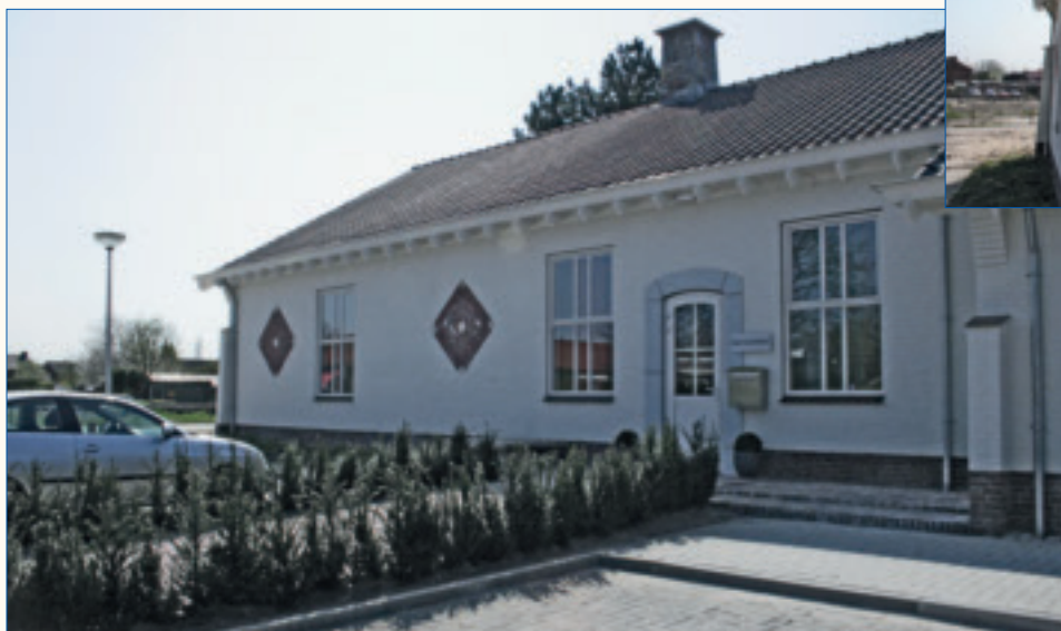
Het nieuwe kantoor in het centrum van Goor.

opdracht gekregen om met bijvoorbeeld beken aan de slag te gaan. Wij helpen ze dan met advisering. We zijn bij dat soort projecten vaak de spin in het web, en werken aan de vormgeving, financiering en de organisatie er omheen.'