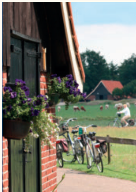
Voor gemeenten houdt Marb Consultancy zich bijvoorbeeld bezig met plattelandsontwikkeling.

In samenwerking met Verbeek's oude werkgever Infram uit Marknesse voerde Marb Consultancy namens het Water-