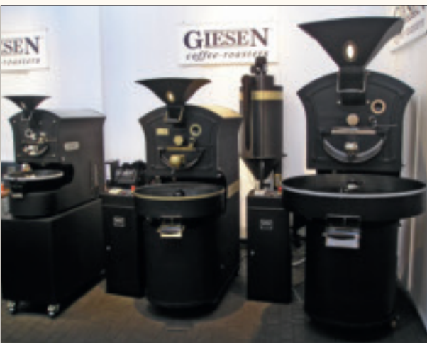
De drie modellen van Giesen Coffee Roasters op een rij: de W1, W6 en W15.