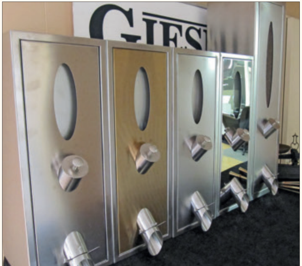
De allernieuwste koffiesilo's van Giesen.

In de geschiedenis van koffie speelt Nederland een niet onbelangrijke rol. Eind zeventiende eeuw smokkelden Nederlandse zeevaarders de koffieplant Coffea Arabica van Mokka, een havenstad aan de Rode Zee, naar Java en later naar Sri Lanka en Zuid-Amerika. Naar verluidt waren het wederom de Nederlanders die de koffieboon op grote schaal naar Europa brachten. Amsterdam zou in de achttiende eeuw zelfs het belangrijkste internationale koffiehandelscentrum zijn geweest, al mag Londen graag wedijveren om deze eer. Koffie en Nederland zijn dus nauw met elkaar verbonden. Toch springt de gemiddelde Nederlander niet zo fantasierijk