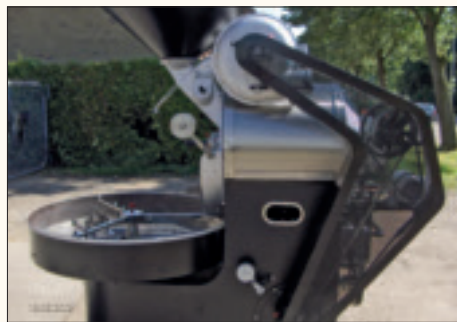
Giesen Coffee Roasters is gespecialiseerd in het reviseren en restaureren van gebruikte koffiebrandmachines van 1 tot 500 kilo, zoals de zeer gewilde UG22.

met koffie om dan eigenlijk zou kunnen. Al komt hier geleidelijk verandering in, getuige de toename van 'koffiekoks', de zogeheten barista's, aldus Wilfred Giesen. Inderdaad, koffie wordt weer hip, een trend die Giesen Coffee Roasters van harte verwelkomt. 'We zien de passie terugkeren. Mensen keren zich steeds meer af van de doorsnee melanges van grote koffiemaatschappijen. Onze afnemers zijn bezielde koffieverkopers van zelfgebrande melanges, zoals koffiebrandereien en koffie- en thee-winkels. Ze zijn stuk voor stuk verliefd op koffie. Bij het zien van een boon worden ze al lyrisch.'