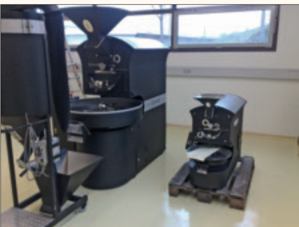
De W15 met daarnaast een zgn. 'ontstener'. Bonen met steentjes zijn funest voor koffiemaal machines.