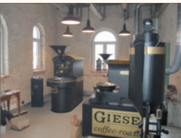
Onder de naam Giesen Education Centers faciliteert Giesen in diverse landen barista-scholen, waar potentiële klanten alles leren over het samenstellen van melanges en het branden en zetten van koffie. Hier de school in Malmö, Zweden.