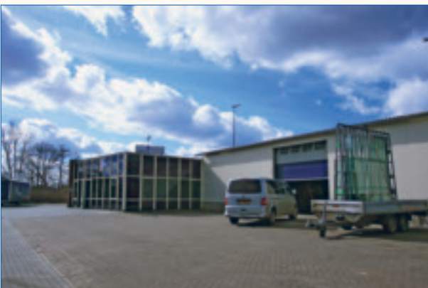
Het pand aan de Wheeweg 31c in Goor.

gebouw van Saxion in Enschede waar we in zeven vakantieweken een hele vleugel opknappen.'