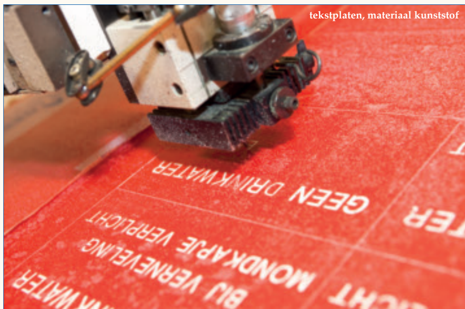
tekstplaten, materiaal kunststof

we merken dat er iets niet klopt – bijvoorbeeld in de tekst of uitvoering – dan trekken we meteen aan de bel. Samen proberen we tot het beste resultaat te komen. Dat merken klanten ook; dat je bereid bent een stap meer voor ze te zetten. Voorop staat het doel dat de klant tevreden is met het geleverde product.'