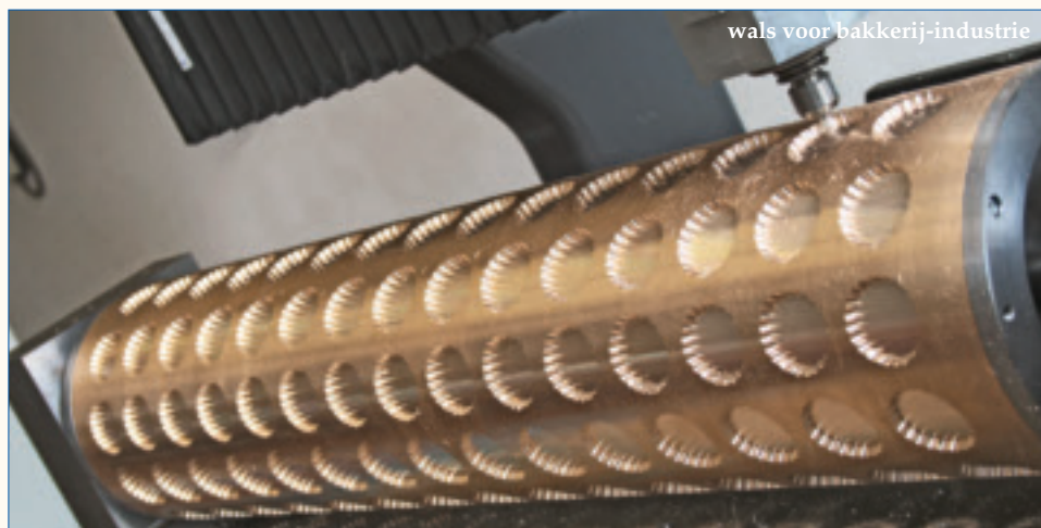
wals voor bakkerij-industrie