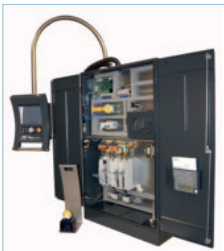
Maatwerk machine besturing: Plug & Play.

zijn ingericht voor laag tot middelgroot volume. In drukke tijden en in geval van grote volumes kennen wij onze wegen in uitbestedingsland. Ook onderdelen die we zelf kunnen maken, maar elders tegen een betere prijs en met de juiste kwaliteit kunnen kopen, zullen we uitbesteden. Het doel is onze klant te bedienen met een technologisch product dat de beste prijs/kwaliteit heeft in de markt.’