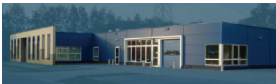
De nieuwe vestiging van het bij de ARA Groep behorende Interay Solutions bv te Burgum.