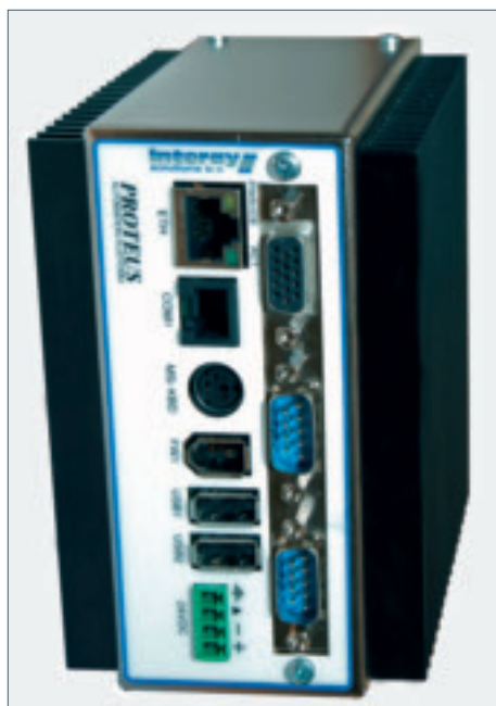
De ultra compacte industriële PC: Proteus.

'Een ander enorm voordeel van engineering en productie in eigen huis is dat wij reserveonderdelen en reparaties kunnen leveren van systemen die wij meer dan twintig jaar geleden hebben uitgeleverd. Wij hebben een logistiek systeem waardoor wij de exacte configuratie tot op het kleinste onderdeel kunnen traceren. We zijn 100% klantgericht en niet productgericht. Wij zijn hierdoor flexibel en gewend aan relatief kleine productieseries. Er zijn niet veel leveranciers van besturingselektronica (PC's en PLC onderdelen) die een nalevering van meer dan vijf jaar kunnen garanderen. Onze klanten leveren veelal kapitaalgoederen van zeer hoge kwaliteit. Deze gaan vele tientallen jaren mee. Wij zorgen ervoor dat wij hiervoor onze onderdelen kunnen blijven leveren. Indien noodzakelijk voeren wij reverse engineering uit om met nieuwe onderdelen 100% uitwisselbare producten te leveren.'