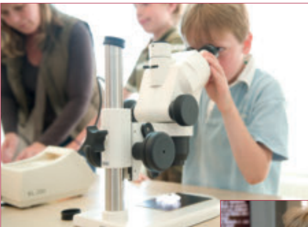
Kinderen kunnen er leuke proefjes doen.

quiz, een filmpje, een behendigheids spel en een spelletje memory. De speelse opzet van het museum en de beeldende wijze waarop de informatie wordt overgebracht, zal zeker ook kinderen aanspreken. Vooral geldt dit voor de proefjes die ze er met zout kunnen doen. Door deze proefjes leren ze eveneens wat over zout- en drinkwaterwinning en de eigenschappen van zout. De proefjes met zout zijn vooral geschikt voor groepsbezoeken of kinderfeestjes en dergelijke.