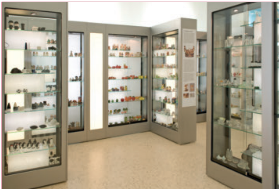
Een deel van de enorme collectie zoutvaatjes.

In de laatste oorlogsjaren was er met Duitsland geen handel meer mogelijk en werd die zelfs verboden. Een Zaanse zoutzieder herinnerde zich dat er in 1886 in het oosten van het land zout in de bodem was gevonden. Direct na de Eerste Wereldoorlog werd toen in Boekelo de 'Zoutindustrie' opgericht, omdat daar in de buurt een bereikbare zoutlaag was aangetroffen. Voor het vervoer van zout lag er al een spoorlijn, dus dat kwam goed uit. Nog voor de Tweede Wereldoorlog werd er ook in Hengelo een zoutfabriek gebouwd. Ondertussen was het Twentekanaal gegraven en werd naast het vervoer per trein ook transport van zout per schip mogelijk. De wijze waarop de zoutwinning in Twente plaats had, is uitgebeeld door middel van een bewegende 'maquette'.