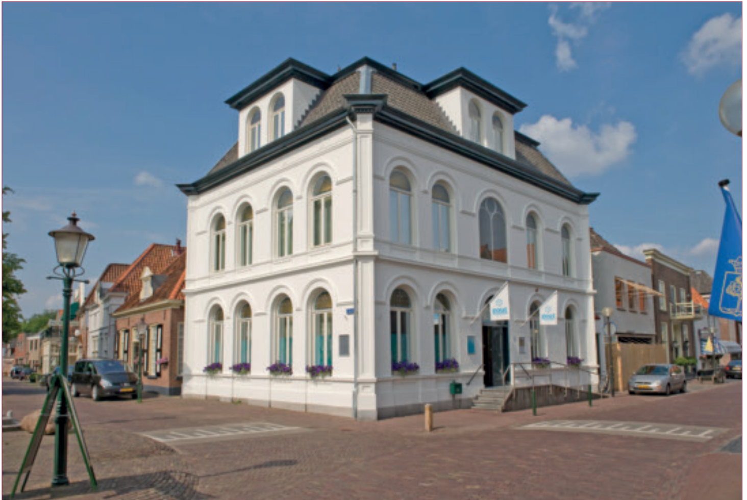
Het Zoutmuseum staat pal in het centrum van Delden.

Ofschoon overmatig gebruik ervan schadelijk is, kan ons lichaam niet zonder zout. Dat besef hadden de Romeinen al. Zout was in hun tijd een belangrijk ruilmiddel. De Romeinse soldaten werden zelfs voor een deel betaald met zout. Van dit gebruik stamt ons woord salaris (sal is het Latijnse woord voor zout).